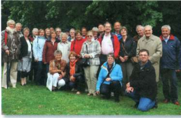
De groene tak

In Heenvliet - ook een voormalige stad met haven aan de Bernisse, zeer welvarend vroeger - krijgen we een vrouwelijke gids die ons veel vertelt over Heenvliet als belangrijke stapelplaats voor de handel op België.