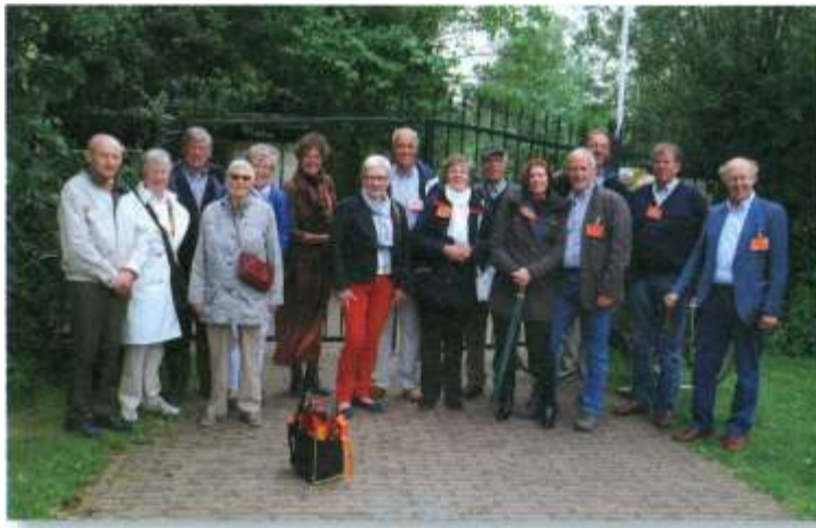
De oranje tak

Tenslotte bezoeken we met haar het best bewaarde geheim van Voorne en Putten --de ruïne Ravestein. Een versterkt woonhuis -donjon uit 1250. In 1572 verwoest door de Geuzen. Rondom de oude ruïne is een landgoed van 5 ha, thans eigendom van de Ambachtsheren.