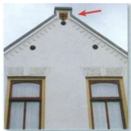
Stadboerderij Geervliet met wapen Herweijer.