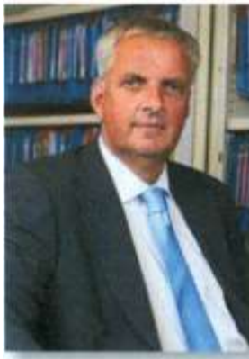
Schil de rentmeester

Op zo'n 30 ha grond worden aardappelen, bieten en tarwe verbouwd, waarbij de werkzaamheden m.b.t. de aardappelteelt geheel worden uitbesteed.