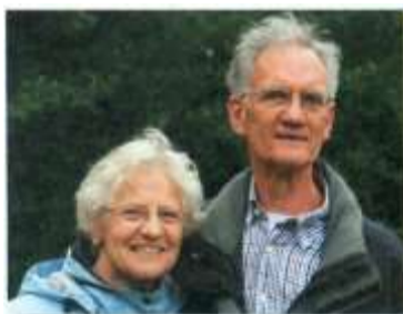
De grijze tak